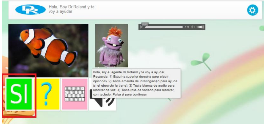
Fig. 1. Agente Dr. Roland, ejemplo de interacción entre el estudiante y el agente (1)